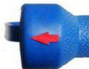
Strzałka wskazująca kierunek strumienia