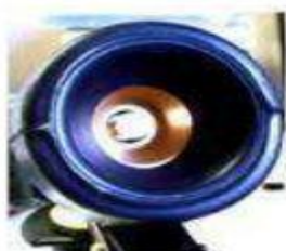
Duży otwór wylotowy